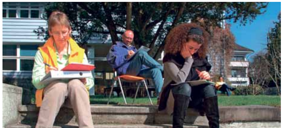
Selbstreflexion im Seminar hilft, persönliche Entwicklungsschritte zu realisieren.

... dass österreichische Forscher zwei Menschentypen identifiziert haben, die speziell erschöpfungsgefährdet sind? Risikotyp A kennzeichnet sich durch ein überhöhtes Engagement und hohe Verausgabungsbereitschaft aus. Risikotyp B hingegen gelangt über Resignation und Motivationseinschränkung in einen Erschöpfungszustand, wenn er für einen ausserordentlichen Arbeitseinsatz keine ausgesprochene Anerkennung findet.