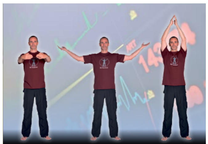
Erst wenige Jahre bekannt: HerzKreis-Training.

Nicht nur Zigaretten, Schweinebraten oder wenig Bewegung verschleissen den Lebensmotor. Auch chronischer Stress, depressive Verstimmungen und andere seelische Nöte machen dem Herz zu schaffen. «Es hat mir das Herz gebrochen»,