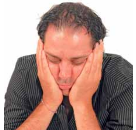
Körper und Nervenkostüm machen schlapp.

Das Gefühl der Erschöpfung ist ein deutliches Zeichen, dass unsere Batterien fast leer sind. Statt immer noch mehr Gas zu geben, fordert uns das Gefühl der Erschöpfung auf, das Bedürfnis nach Ruhe und Entspannung ernst zu nehmen. Nur Sie selbst können Ihre Batterien auffüllen. Überlegen Sie sich jetzt schon, was Sie entspannt und was Ihnen Ruhe bringt. Damit Sie beim nächsten Mal darauf zurückgreifen können.