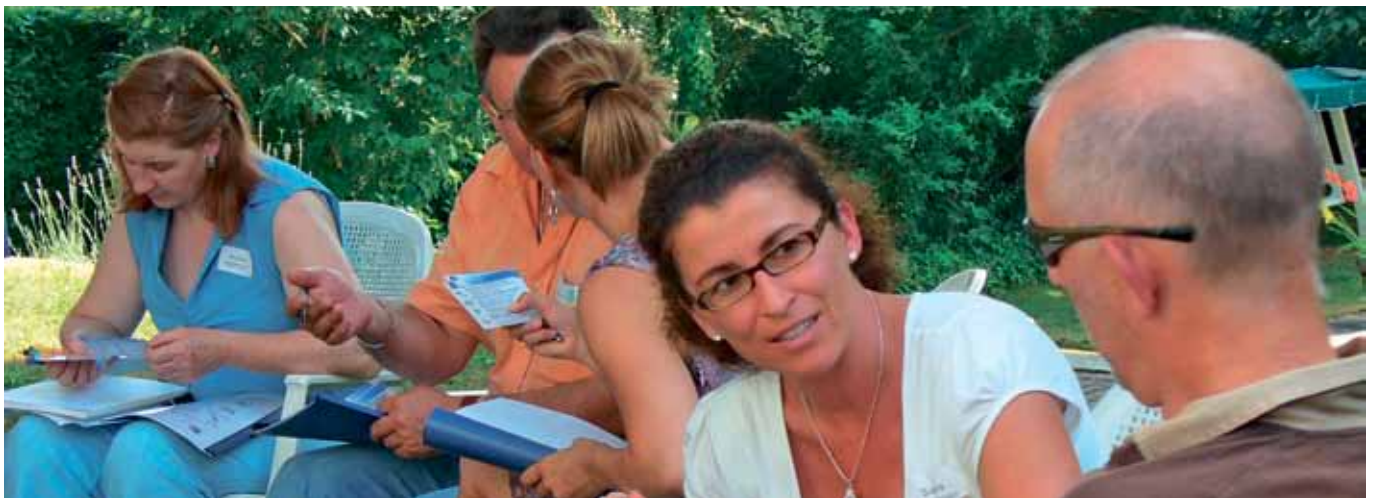
Üben an eigenen Beispielen ermöglicht einen guten Praxistransfer in den Alltag.

Daten für Infoabende, die aktuellsten Kursdaten sowie Detailbeschriebe für unsere Seminare finden Sie auf unserer Homepage www.tcco.ch .