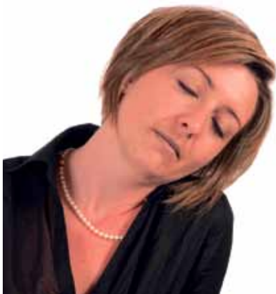
Erschöpfung ist ein Alarmsignal.

*Schulungen: Metapuls / Coaching und Teamcoaching: The Coaching Company.