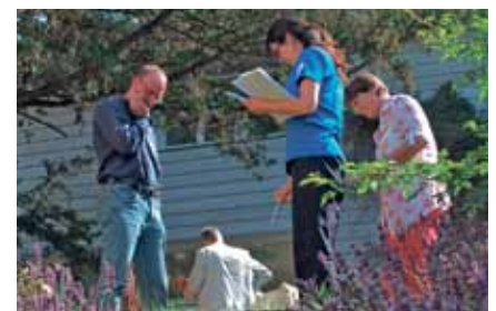
Gemeinsames Üben im Seminar.

*Voraussetzung: 2-tägiges Einführungsseminar bei einem/einer zert. GFK-TrainerIn.